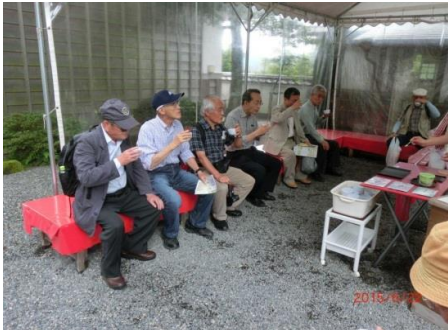
三千院前の茶屋で紫蘇茶？を試飲中