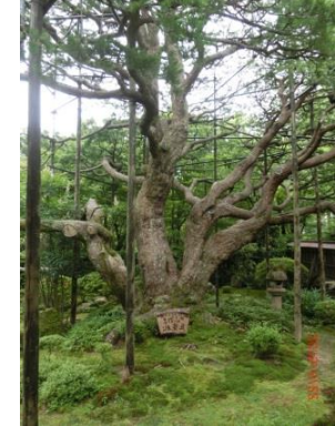
宝泉院庭園五葉松