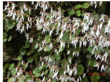
ユキノシタの花のクローズアップ