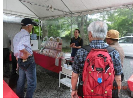
茶屋のおばさんの説明を聞きく